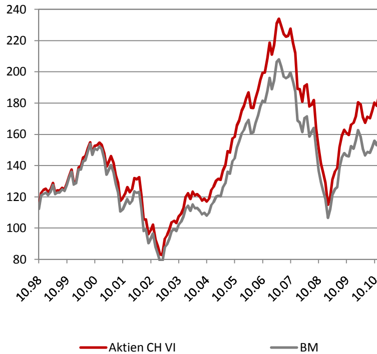
Performance Oktober 1998 bis Dezember 2010